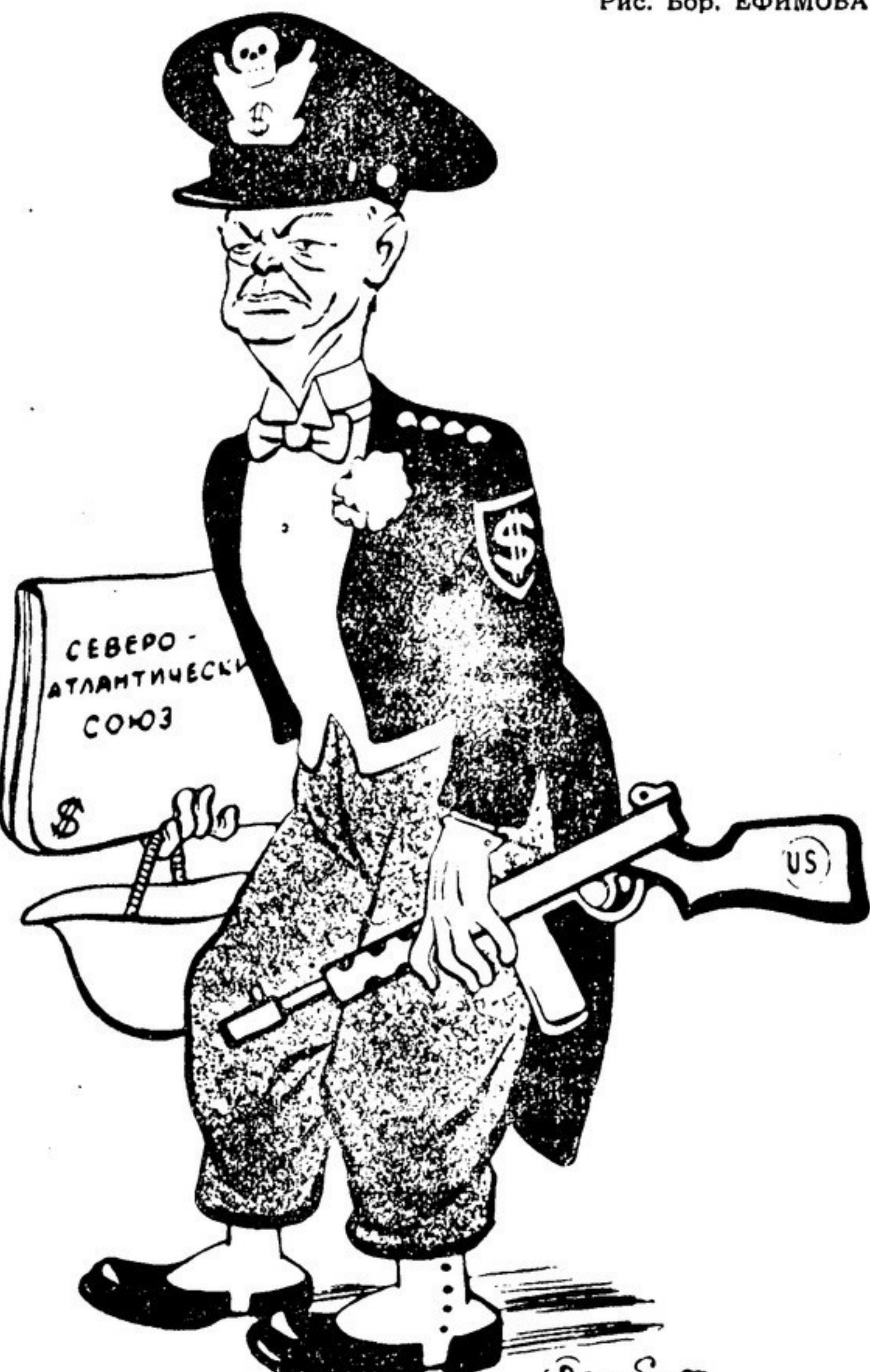
Рис. Бор. ЕФИМОВА

Монтгомери выступил в роли спасителя американцев.